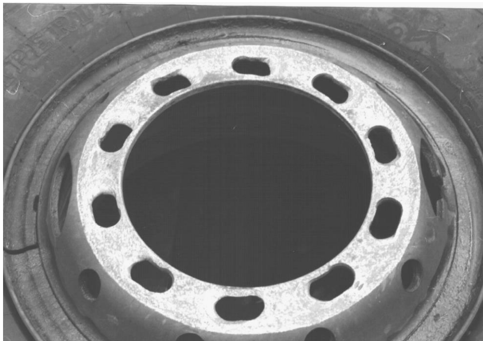
5. Bild: inneres Rad mit den erzeugten Langlöchern