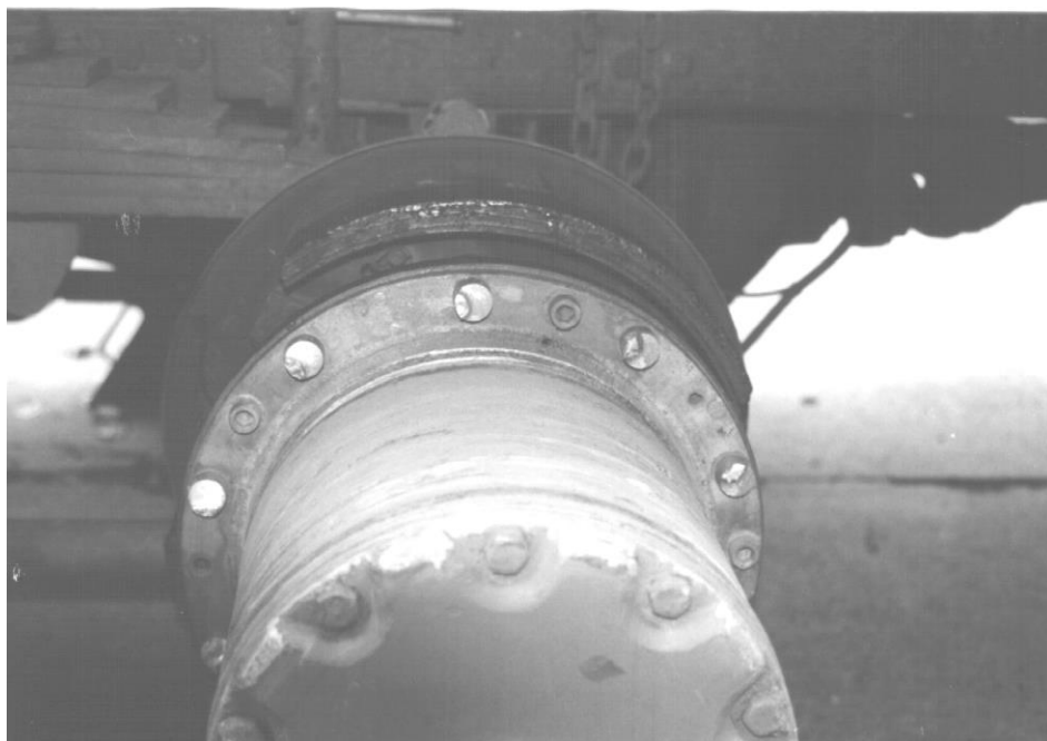
3. Bild: abgescherte Radbolzen