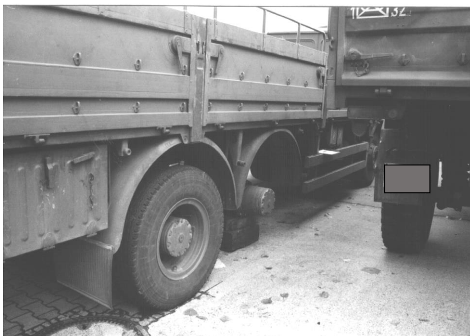
2. Bild: Fahrzeug von hinten rechts mit verlorenen Rädern der 2. Achse