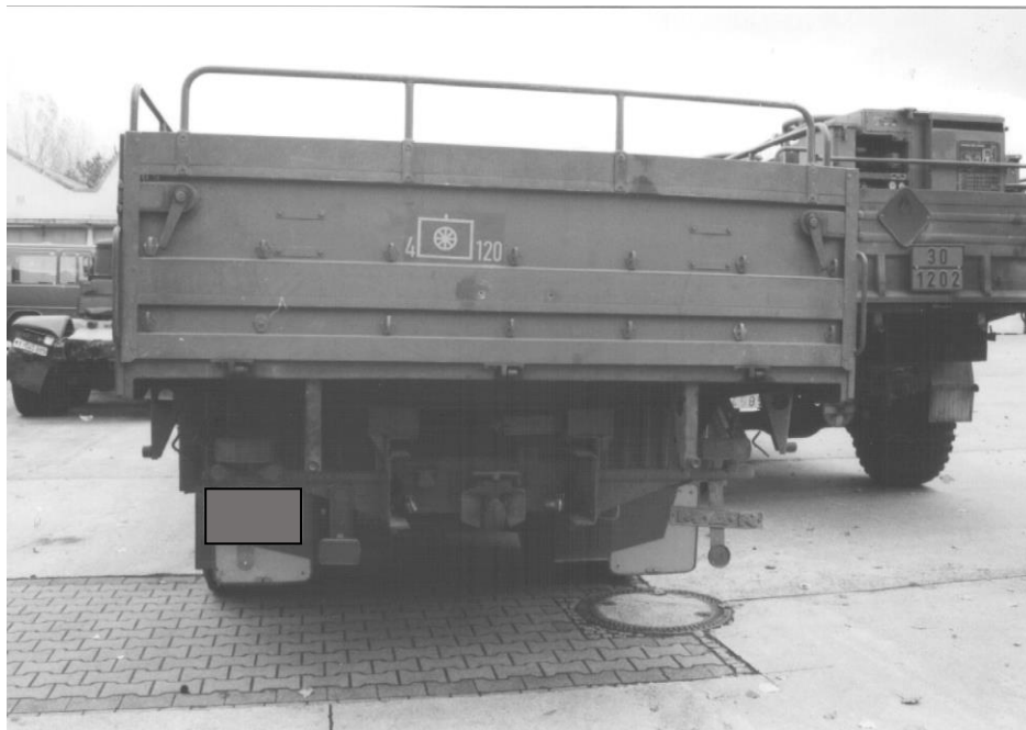
1. Bild: Fahrzeug von hinten