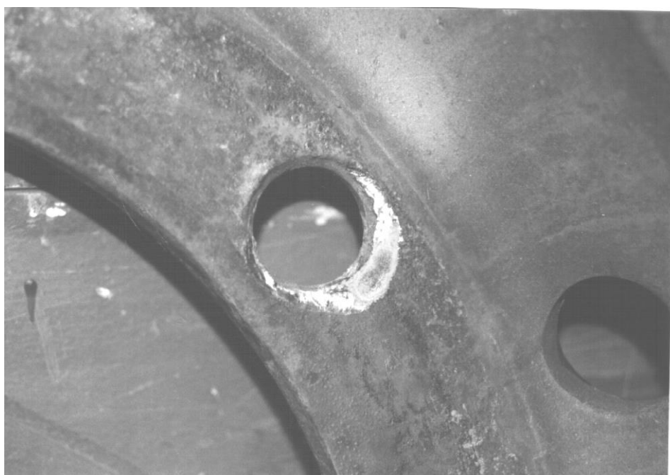
6. Bild: Reserverad mit Verschleißspuren der Muttern ohne äußeren Konusring